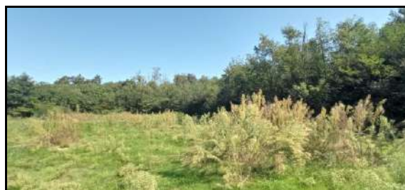
5 - Fotografie scattate nei diversi punti visuali della sotto-area C