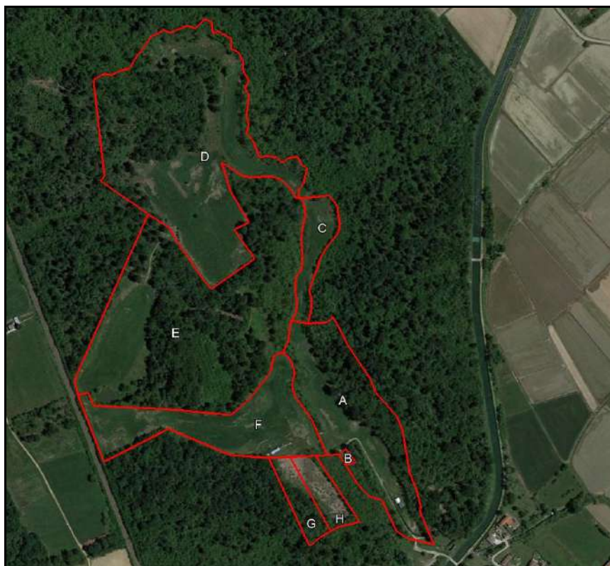
1 - Area di esame con suddivisione in sotto-aree A-H (in rosso)