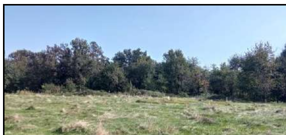
7 - Fotografie scattate nei diversi punti visuali della sotto-area E