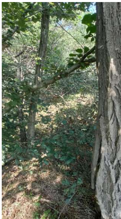
9 - Fotografia scattata nel punto visuale della sotto-area G