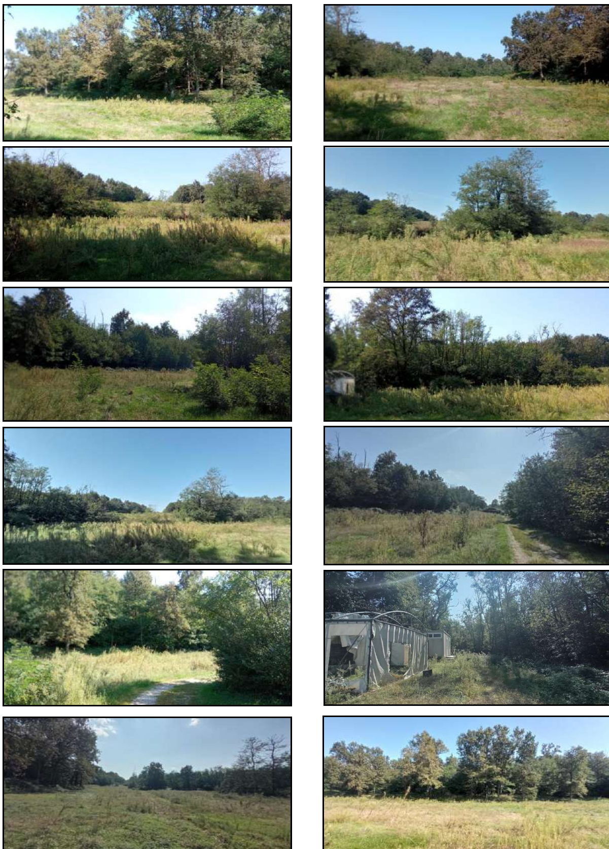
3 - Fotografie scattate nei diversi punti visuali della sotto-area A