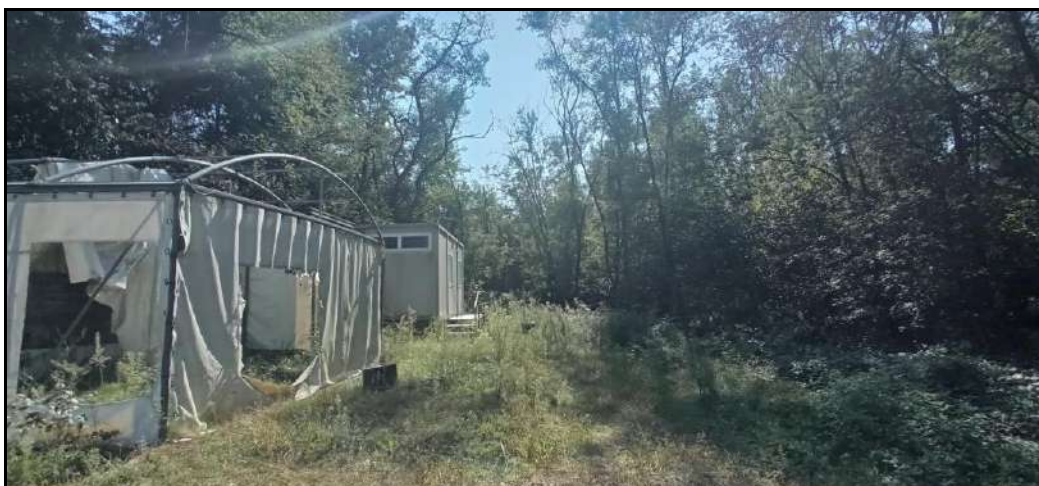
4 - Fotografia scattata nel punto visuale della sotto-area B