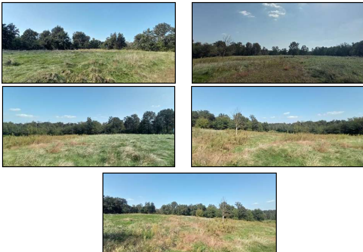
6 - Fotografie scattate nei diversi punti visuali della sotto-area D