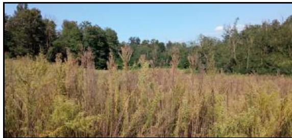
8 - Fotografie scattate nei diversi punti visuali della sotto-area F