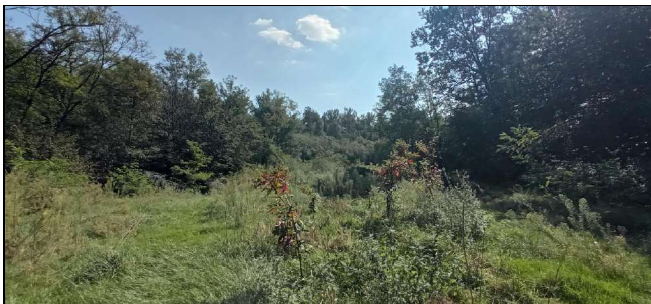
10 – Fotografia scattata nel diversi punto visuale della sotto-area H